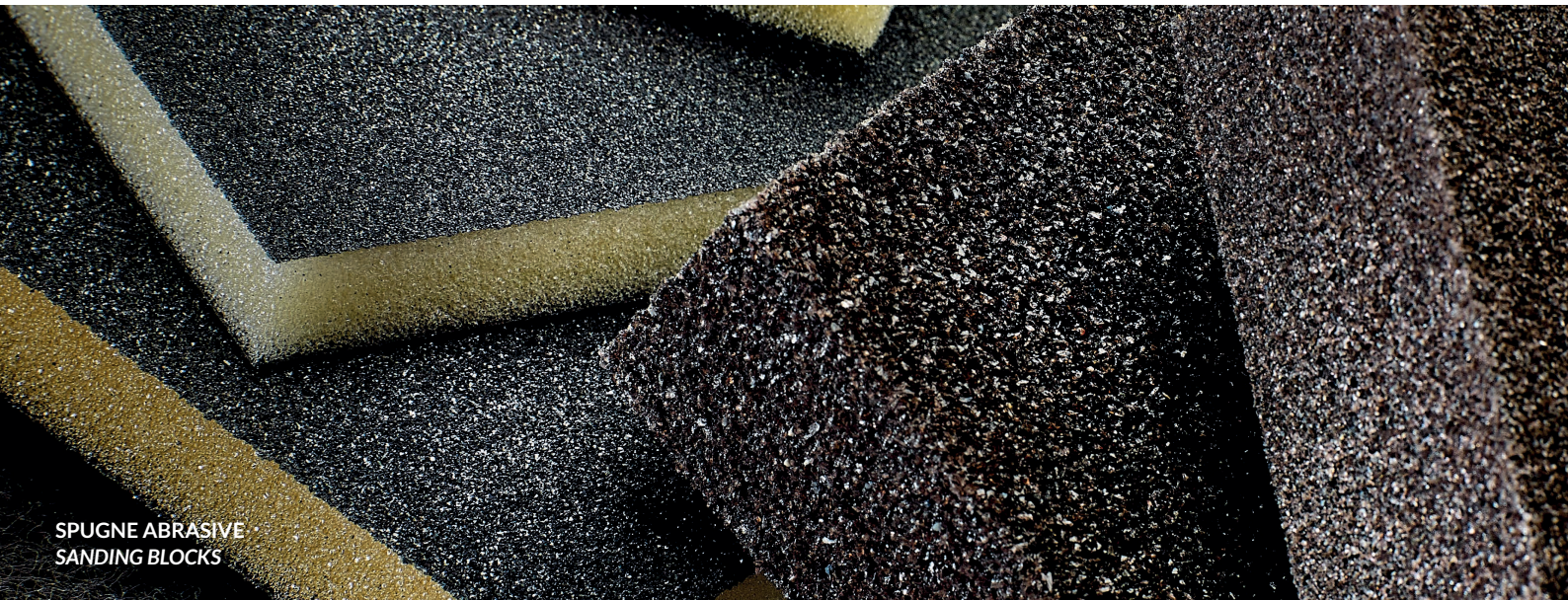
SPUGNE ABRASIVE SANDING BLOCKS